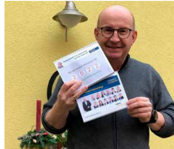
Der mittlerweile 16. ÖVP – Gemeindekalender mit allen wichtigen Terminen ist bereits in den Haushalten unserer Gemeinde. Wir bedanken uns recht herzlich bei der heimischen und regionalen Wirtschaft für die Unterstützung.

jene verhöhnt, die in den Spitälern und im Pflegebereich unter schwierigsten Bedingungen an die Grenzen ihrer Belastbarkeit gekommen sind. Den Mitarbeiterinnen und Mitarbeitern in den Kliniken und Heimen gebührt unser höchster Respekt. Es ist daher absurd, wahnwitzige medizinische Thesen zu propagieren um die Leute von der Impfung abzuhalten. Geht's noch? Es ist wirklich ärgerlich und wird, wie es nun absehbar ist in einer Impfpflicht enden. Scheinbar geht es nicht anders.