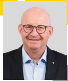
Bürgermeister Ing. Roland Nagl