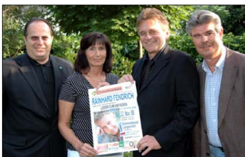
22.Nov. 2008 Rainhard Fendrich im Gemeindesaal in Langenrohr

Es wird immer wichtiger mit einem verlässlichen Partner zu arbeiten. Mehr als 350 Events haben wir in den letzten Jahren organisiert. Für Eröffnungen, offizielle Anlässe, Jubiläen, Präsentationen u.v.a. ist MVM ein zuverlässiger Partner.