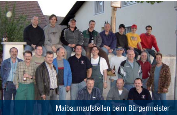
Maibaumaufstellen beim Bürgermeister