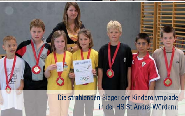
Die strahlenden Sieger der Kinderolympiade in der HS St. Andrä-Wördern.