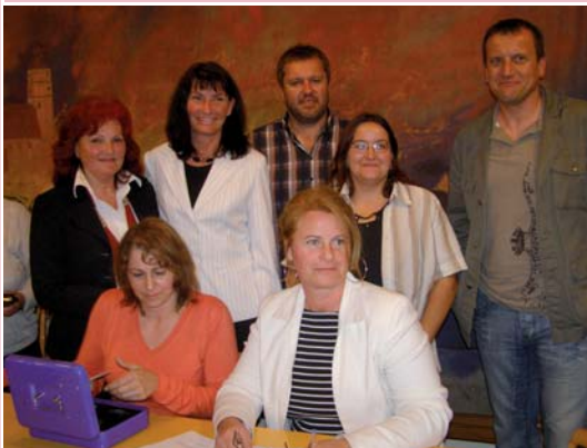
VEREIN „RETTET DAS PARKBAD“ ▲ Der neu gewählte Vorstand unseres Parkbad-Vereines

Natur und Kultur vereint bei der Sommerfahrt des Alpenvereins: Egger-Lienz und die Lienzener Berge.