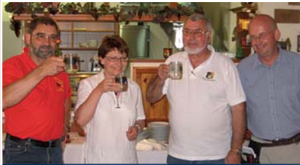
Schützenbesuch aus Langenwang.