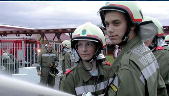
Brandschutzübung bei der Reitakademie