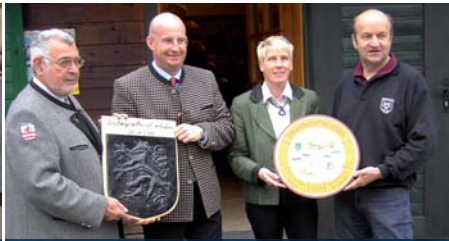
Freundschaftsschießen in Wildalpen.